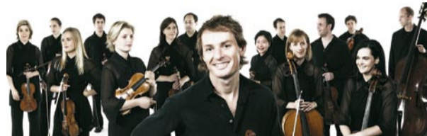
Avstralski komorni orkester