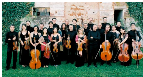
Italijanski godalni orkester