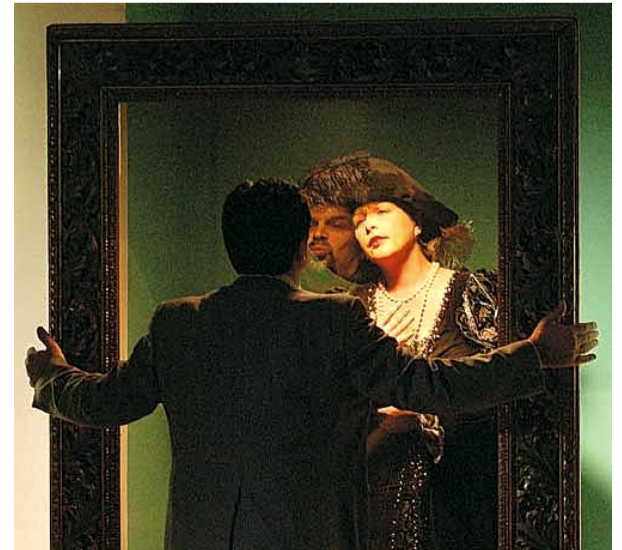
FANTOM V HÄNDLOVI HIŠI

V primeru, da bi posamezne šole želele za svoje učence in dijake odkupiti predstave cikla za mlade, bomo ponovitve predstav oz. koncertov izvajali tudi v dopoldanskem času.