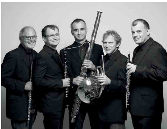
Pihalni kvintet Slowind