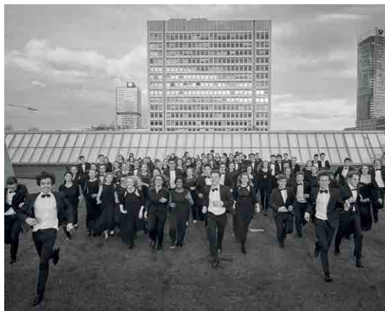
Nemški narodni mladinski orkester