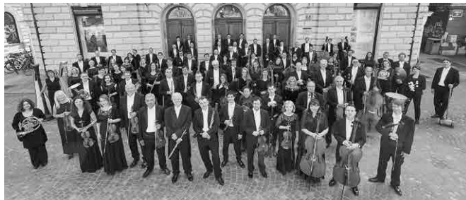
Orkester Slovenske filharmonije