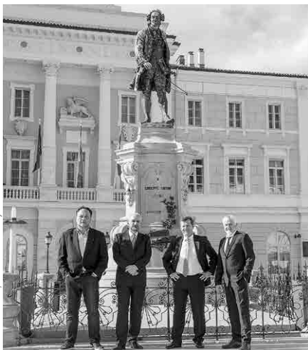
Kvartet Tartini, foto: Nataša Fejton

Sporod: Giuseppe Tartini, Ludwig van Beethoven, Bedřich Smetana