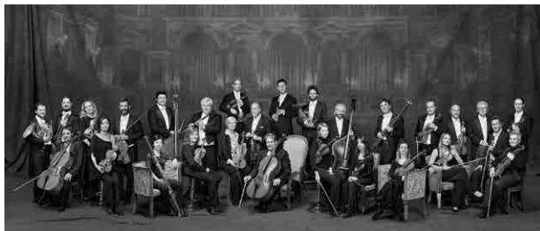
Komorni orkester iz Mantove

Spored: Felix Mendelssohn, Camille Saint-Saëns