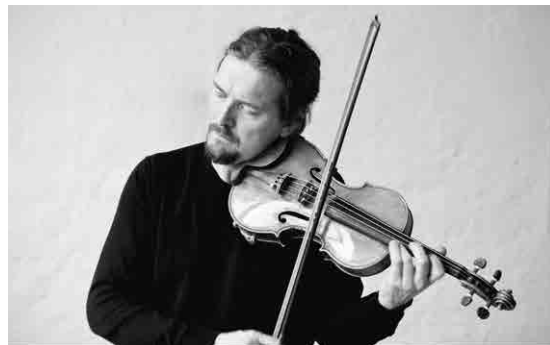
Christian Tetzlaff

danes sodi med najuglednejše svetovne violiniste. Obisk njegovih koncertov se pogosto izkaže za pravo eksistencialno izkušnjo, saj se lahko že znana dela nenadoma pokažejo v povsem novi luči. Obenem Tetzlaff rad iz pozabe obuja pozabljene mojstrovine. S predanostjo neguje nenavadno obsežen repertoar in vsako leto izvede približno sto koncertov. Pogosto deluje kot rezidenčni umetnik; na tak način so ga k sodelovanju povabili Berlinski filharmoniki, Filharmonični orkester iz Seula in Dresdenski filharmoniki. V svoji karieri je Christian Tetzlaff gostoval z vsemi velikimi