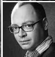
Aleksander Melnikov