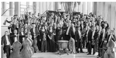
Madžarski narodni filharmonični orkester