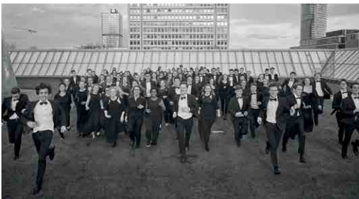
Nemški narodni mladinski orkester

Spored: Ludwig van Beethoven, Klaus Huber, Sergej Maingardt