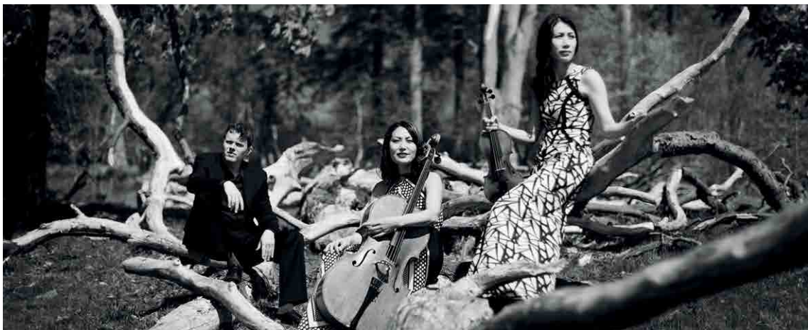
Trio con brio iz København

»Svetleče kritike so resnične. Trio con brio iz København jasno zaseda vzvišen položaj na današnji glasbeni sceni.« Washington Post