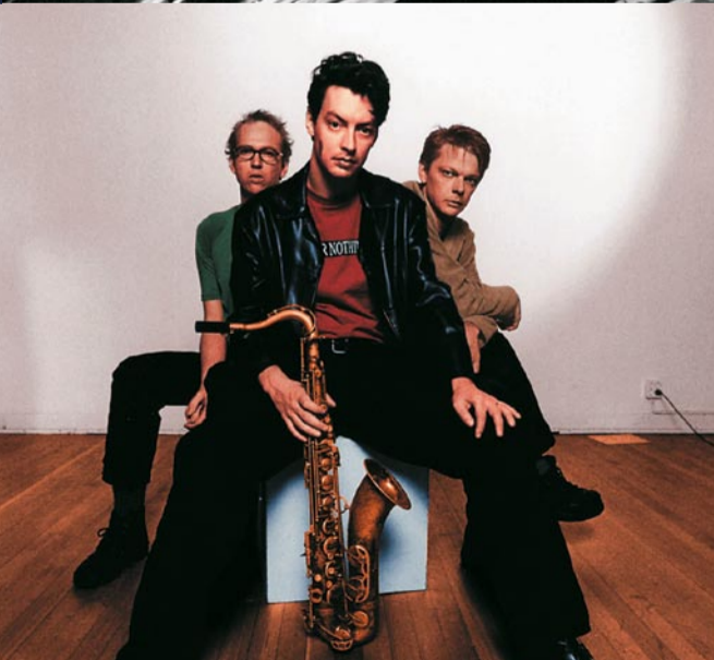
YURI HONING TRIO