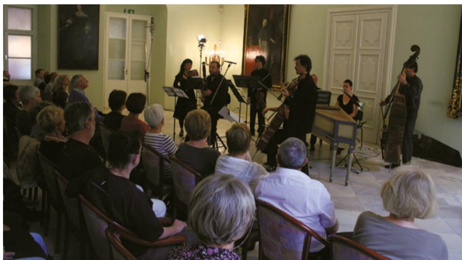
Jutranje refleksije v Viteški dvorani Mariborskega gradu – Tudi Viteška dvorana Mariborskega gradu se je obnesla kot izjemen prostor za koncertno matinejo ter za enega odličnih koncertov t.i. jutranjih refleksij, sicer nadpovprečno dobro obiskanega festivalskega programa.