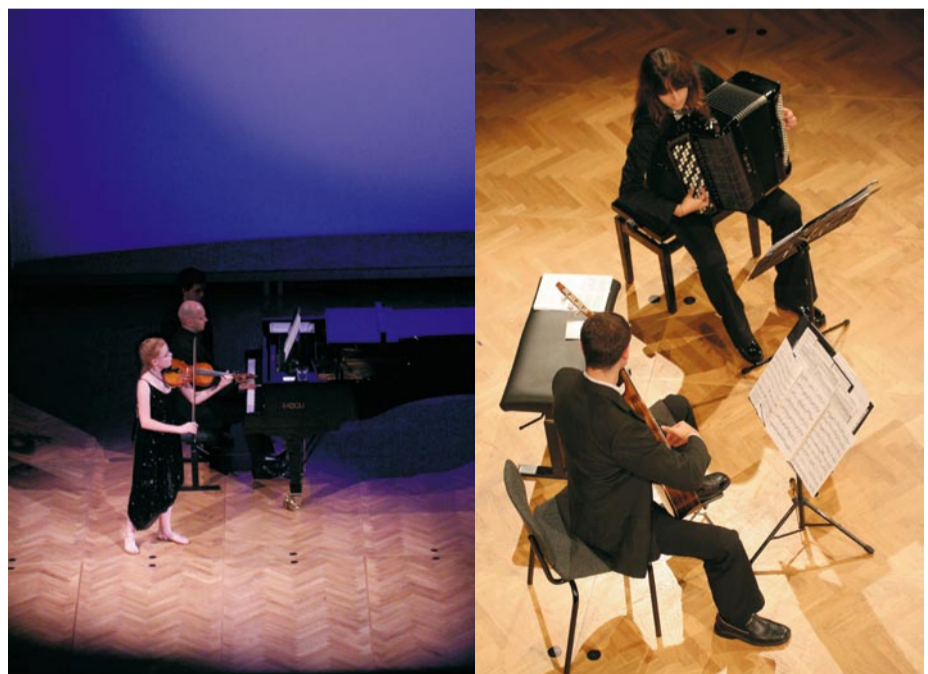
Salon glasbenih umetnikov 2008

Izbirno zasedb bo opravila selekcijska komisija, kandidate pa bomo o izboru obvestili najkasneje do 31. januarja 2009. V kolikor vam bodo potrebne dodatne informacije v zvezi z razpisom, nas pokličite na telefon 02/229 40 14 ali pošljite elektronsko pošto na naslov: tina@nd-mb.si