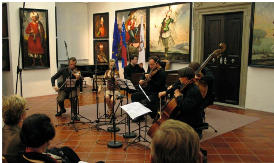
Večer na Ptujskem gradu – Ob odlični glasbeni zasedbi sta večerni čar Ptujškega gradu in ambient njegove Viteške dvorane omogočila, da je koncert z naslovom Večer na gradu obiskovalcem pričaral še posebno vzdušje.