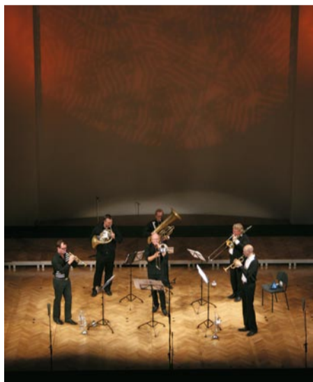
Švedski trobilni kvintet in Christian Lindberg – S Švedskim trobilnim kvintetom se je predstavil tudi slavni švedski pozavnist, skladatelj in dirigent Christian Lindberg, ki je svoj virtuozen nastop začel s ščepcem humorja in tako poskrbel za izjemno navdušenje občinstva.