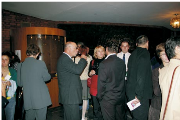
Glasbeno-septembrsko vzdušje po koncertih v avli Dvorane Union