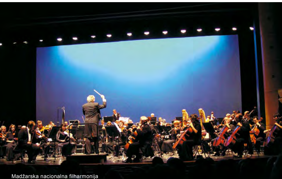
Madžarska nacionalna filharmonija