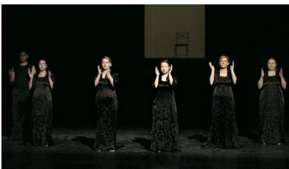
Sobota, 2. december 2006, ob 19.30, Mariborska stolnica

dnjeveški anonimni skladatelji in Arvo Pärt so s svojo glasbo oblikovali edinstveni odgovor na krščansko zgodbo. Glasba odraža strast, pri kateri človek stremi, da bi ustvaril vez za dušo, ki se vzpenja od zemlje do nebes.