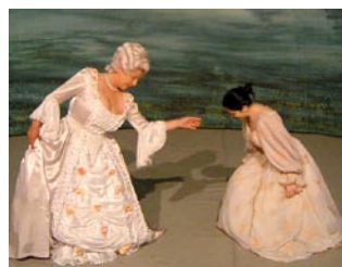
Četrtek, 7. december 2006, ob 18.00, Dvorana Union Maribor