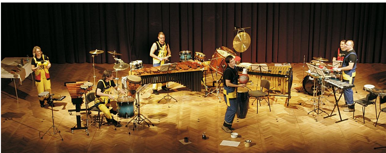
SLOVENSKI TOLKALNI PROJEKT – SToP-ovci so nas s svojim »bobnarskim« dogodkom zagotovo prepričali, da lahko tolkalo postane vsak predmet okrog nas.