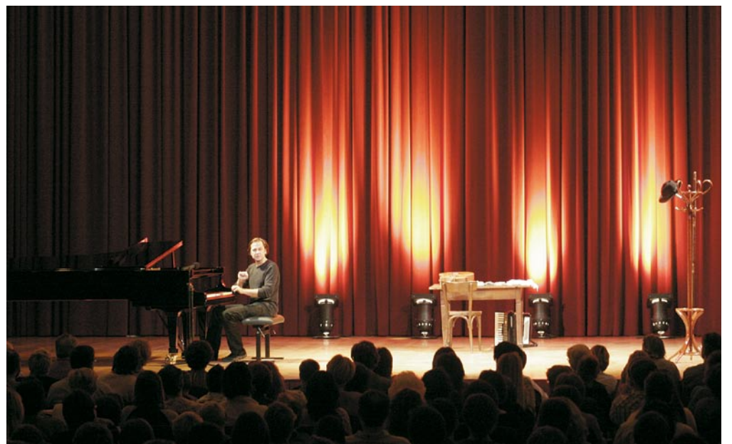
Sreda, 15. november 2006, ob 11.00, Dvorana Union Maribor

Jure nas je že v mesecu septembru, v okviru Glasbenega septembra, na izjemno zanimiv in privlačen način popeljal skozi zgodovino glasbe ter nam njen razvoj slikovito približal s šalami in z anekdotami. Predstavil nam je fenomen glasbe v vsej njeni raznovrstnosti. S svojim ilustrativnim, duhovitim, a vendar strokovno verodostojnim in virtuoznim nastopom se bo tudi tokrat mojstrsko prelevil iz ene vloge v drugo in se tako kot pianist, pevec, skladatelj, dirigent, muzikolog ali tudi kot glasbeni kritik ponovno dotaknil zgodovine in razvoja glasbe, komponiranja in glasbenih posebnosti, podkrepljenih s primeri iz prakse. Od kamene dobe do Rolling Stonesov, od klasike do moderne, od jaza do popa, od popevke do šansona. Po ogledu predstave Od tišine do glasbe bo dobra (tudi klasična) glasba nekaj časa zanesljivo »cool«. Dovolj dolgo, da bo vzbudila zanimanje zanjo pri vseh, ki imajo v sebi vsaj osminko talenta za to lepo umetnost.