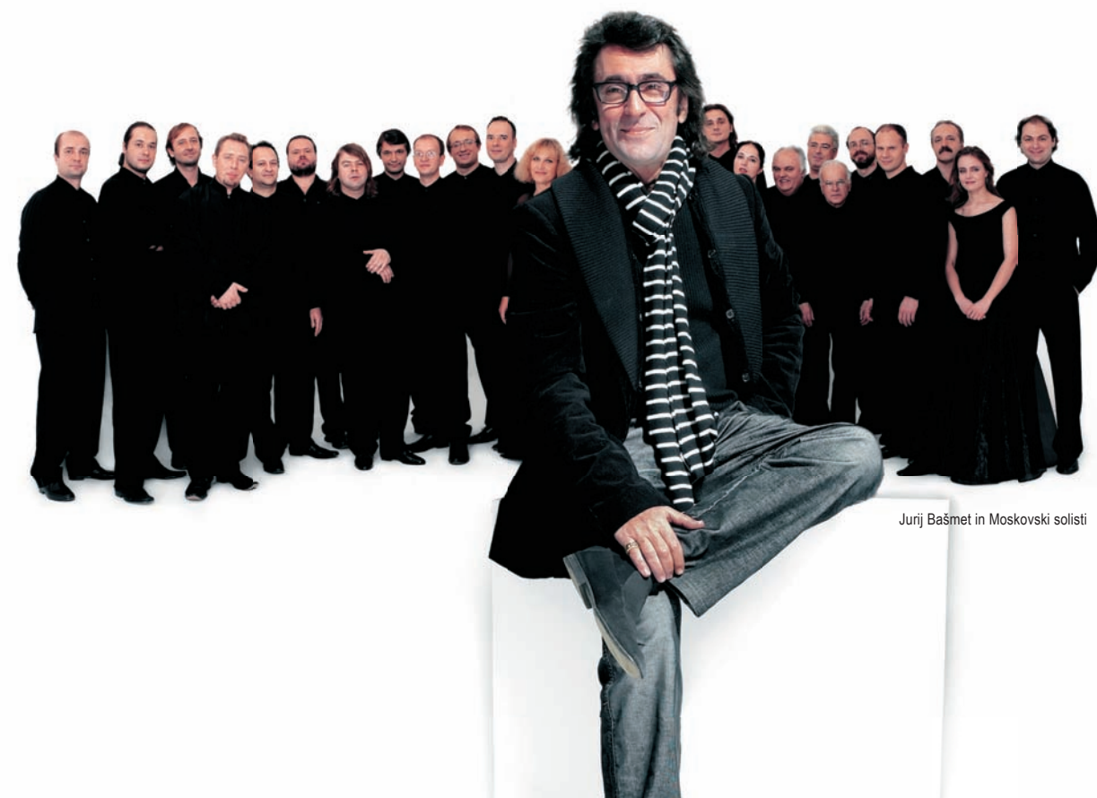
Jurij Bašmet in Moskovski solisti