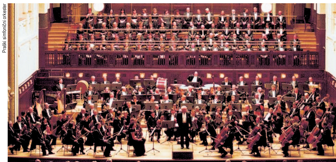
Praški simfonični orkester