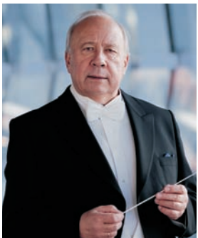
Neeme Järvi (Simonvan Boxtel)