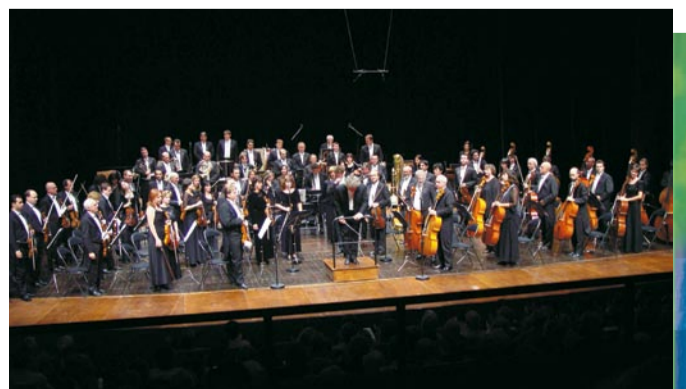
Madžarska nacionalna filharmonija