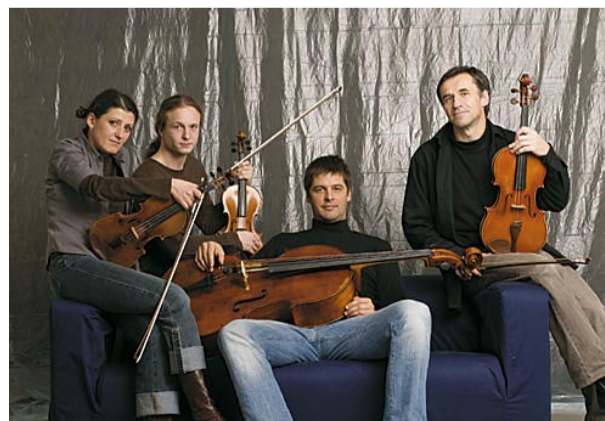
Godalni kvartet Godalika