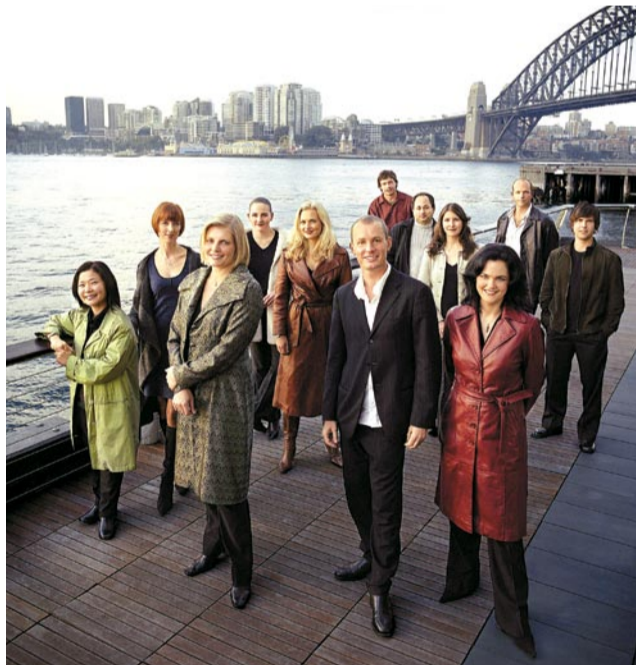
Avstralski komorni orkester