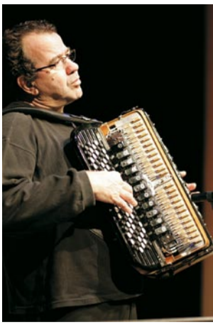
RICHARD GALLIANO

● Sobota, 15. september 2007, ob 19.30 Dvorana Union Maribor