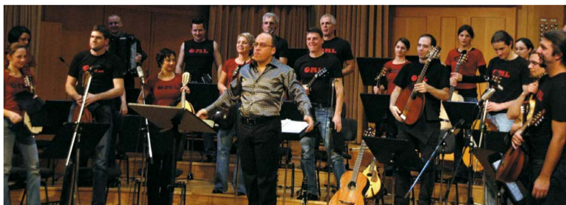
Orkester Mandolina Ljubljana

1 Četrtek, 17. 10. 2013 ob 15.00 – Furioso 1 ob 18.00 – Furioso 2 Dvorana Union, Maribor