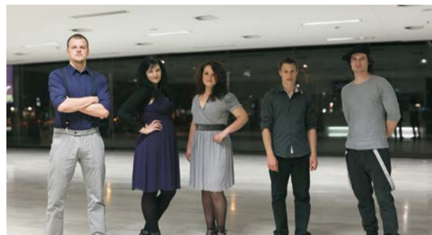
Vokalna skupina A-Kamela