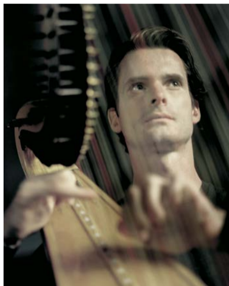
Xavier de Maistre