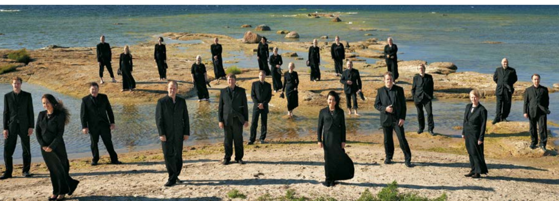
Estonki filharmonični komorni zbor