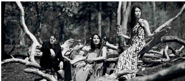
Trio Con brio iz Københavna

Sporred: Ludwig van Beethoven, Per Nørgård, Dmitrij Šostakovič