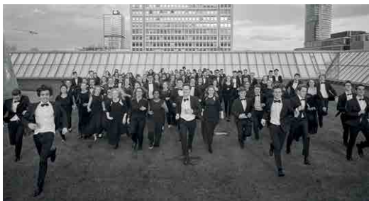
Nemški narodni mladinski orkester