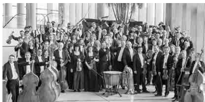
Madžarski narodni filharmonični orkester