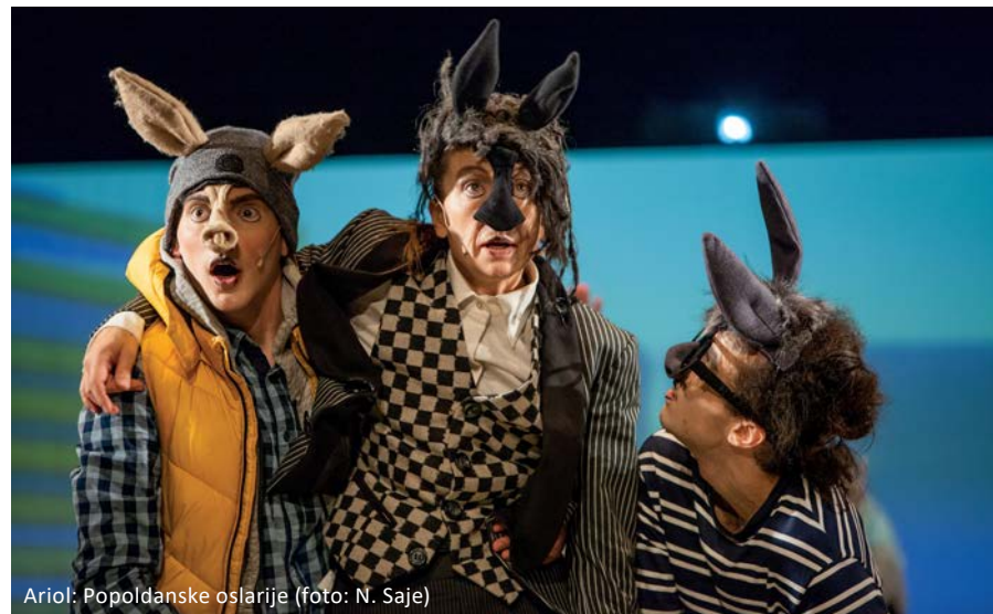
Ariol: Popoldanske oslarije