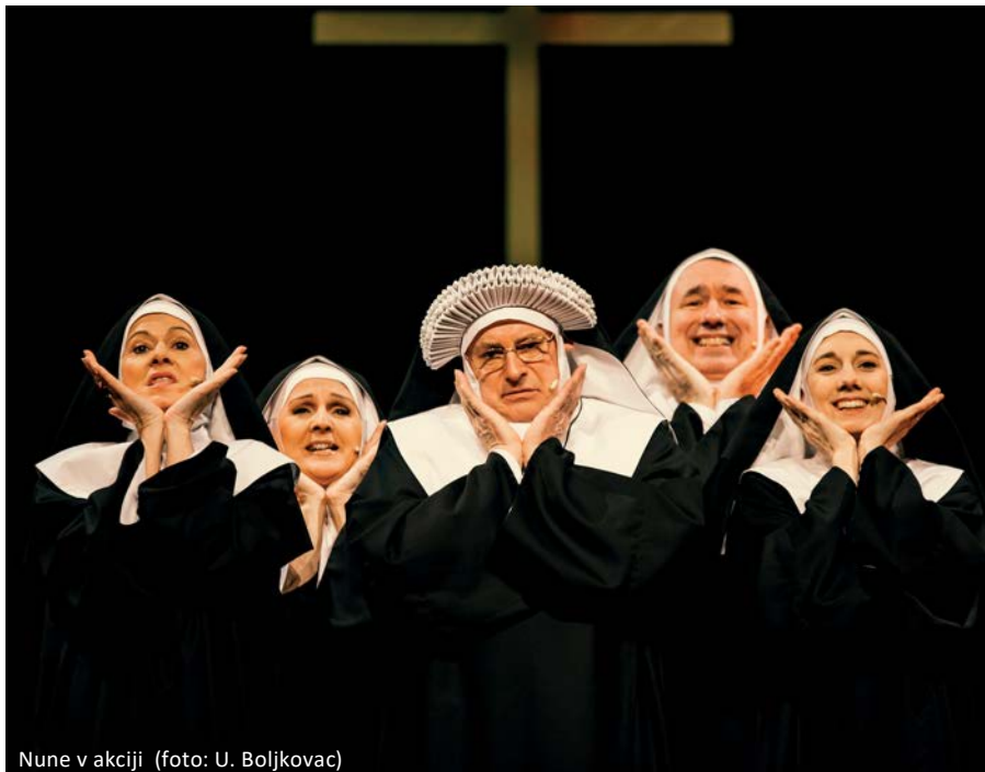
Nune v akciji

Zato verjamemo, da vas bo program prihajajoče sezone ponovno prepričal, saj je poln najnovejših, najbolj aktualnih in smešnih predstav, ki so jih ustvarili mojstri komedijantskega peresa.