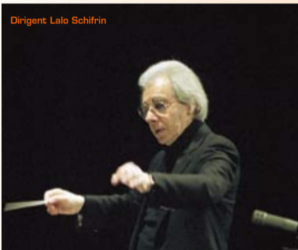
Dirigent Lalo Schifrin